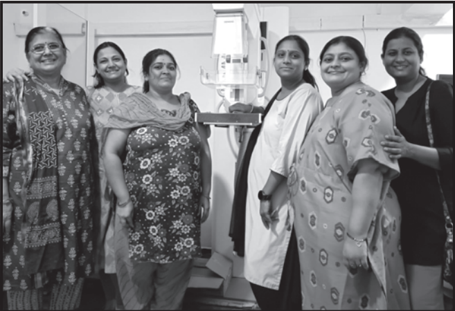
પાલડી મેડિકલ સેન્ટર ખાતે મેમોગ્રાફી ટેસ્ટ કરાવતી સમાજની બહેનો

અંતમાં, કેન્સર નિદાનના ટેસ્ટ કરાવવા માટે લીધેલ ડિપોઝીટ, જે બહેનોએ ટેસ્ટ કરાવી લીધા હતા એમને પરત અપાઈ