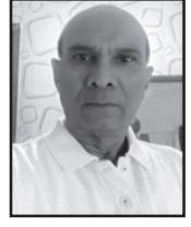
વિનોદભાઈ માછી નિરંકારી

એક કુંભારને માટી ખોદતાં અચાનક એક હીરો મળે છે. કુંભાર હીરાને ગધેડાના ગળામાં બાંધે છે. એક દિવસ એક વાણિયાની નજર ગધેડાના ગળામાં બાંધેલા હીરા ઉપર પડે છે. વાણિયો કુંભારને આ હીરાનું મૂલ્ય પૂછે છે. ત્યારે તેનું મૂલ્ય સવા શેર ગોળ બતાવે છે. વાણિયાએ સવા શેર ગોળ આપીને આ હીરો ખરીદી લે છે. વાણિયાને પણ આ હીરાનું મૂલ્ય ખબર ના હોવાથી ચમકીલો પદાર્થ સમજીને પોતાના ત્રાજવાની કાંડીએ બાંધી દે છે.