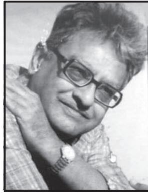
કવિ રમેશ પારેખ

ઈ.સ. ૧૯૬૭માં સર્જનની શરૂઆત કરીને કવિતા ક્ષેત્રે ધોધમાર ગીત - ગઝલનો વરસાદ વરસાવી ભાવકો અને કાવ્ય પ્રેમીઓને ભીંજવી દેનારા અમરેલીના કવિ રમેશ પારેખ સૌના પ્રિય કવિ છે. વિવેચકોની આંખ એમના સર્જન ઉપર ખંડાઈ અને ક્યાં, ખડિંગ, ત્વ, હાઉક, દે તાલ્લી, ચીં, સતનન, ખમ્મા આલા બાપુને, મીરાં, સામે પાર, વિતાન સુદ બીજ અને કુમાર ચંદ્રક, નર્મદ ચંદ્રક, રણજિતરામ સુવર્ણ ચંદ્રક, સંસ્કાર એવોર્ડ, કલા ગૌરવ એવોર્ડ પ્રાપ્ત કરનારા અને મોરારિબાપુના પણ પ્રિય કવિ રમેશ પારેખ છે.