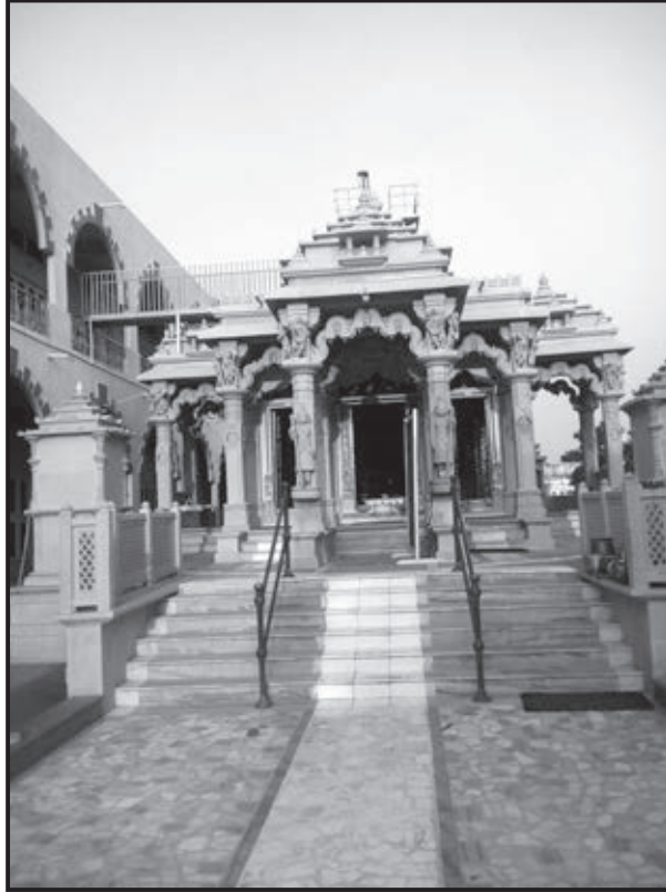
મહાવીર સ્વામી જિનાલય : અંજાર

અજયપાળ ચૌહાણ (૮મી-૯મી સદી) અને જેસલ જાડેજા (૧૩૧૮-૧૩૭૫) સથે ઐતિહાસિક સંબંધ ધરાવતું 'અંજાર' દેવાલયો, શિવાલયો અને જિનાલયોથી શોભતું શહેર છે. અત્યારે અંજારમાં કુલ પાંચ જિન મંદિરોની ધજા ફરકે છે. તેમાં તપગચ્છનાં વાસુપૂજ્ય (વર્ધમાન નગર) અને મુનિ સુવ્રતસ્વામી (જેસીસ નગર), અચલગચ્છનું વિમલનાથ (ચંપક નગર), ખરતરગચ્છનું અભિનંદન સ્વામી (જિનકુશલસૂરિ દાદાવાડી, વરસામડી નાકા) અને પાંચમું તે શ્વેતાંબર મૂર્તિપૂજક જૈન સંઘ સંચાલિત મહાવીર સ્વામી (જૈન કોલોની)નો સમાવેશ થાય છે.