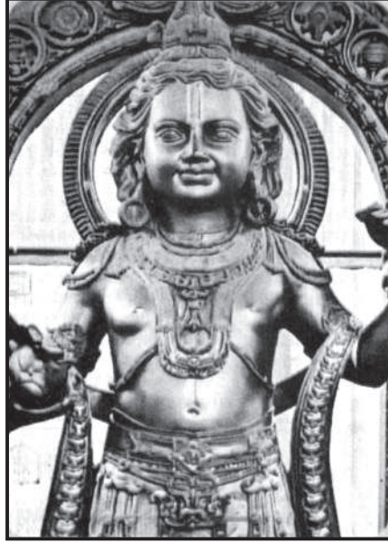
રામલલ્લાનું મનોહર સ્વરૂપ

અયોધ્યામાં રામ મંદિર નિર્માણનો માર્ગ મોકળો કરતા અદાલતી ચુકાદાના દિવસ ૯મી નવેમ્બર, ૨૦૧૯ની જેમ તેના સવા ચાર વર્ષ બાદ હવે તેની પ્રતિષ્ઠાનો શુભ દિવસ ૨૨મી જાન્યુઆરી, ૨૦૨૪ પછી દેશની આધ્યાત્મિક તવારીખમાં સુવર્ણક્ષિરે સ્થાન પામ્યો છે. આખો દેશ જે ઐતિહાસિક ક્ષણની આતુરતાથી રાહ જોઈ રહ્યો હતો તે રઘુકુળની રાજધાની અયોધ્યામાં ભગવાન રામ પોતાના રમ્ય, નવ્ય, ભવ્ય અને દિવ્ય દેવાલયમાં બિરાજમાન થયા છે. આ મંદિર રામના જીવન પ્રતિ દરેક ભારતીયની અતૂટ આસ્થાનું પ્રતીક છે.