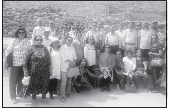
ધોળાવીરા ખાતે વડીલો

ગયો કે પાણીથી બંને બાજુ જાણે સમુદ્ર લહેરાતો હોય તેવો ભાસ થતો અને વચ્ચેથી આ રોડ પરથી પસાર થતી બસે અમને રામેશ્વરના રોડની યાદ અપાવી. જ્યાં પાણીનો અભાવ હતો ત્યાં બંને બાજુ અફાટ સફેદ રણને નિહાળવાનો અનુભવ આહલાદક હતો.