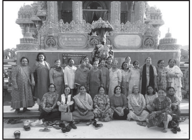
શ્રી તારંગા ધામ ખાતે વડીલો

બસ જેમ જેમ આગળ વધતી ગઈ તેમ તેમ ખ્યાલ આવતો