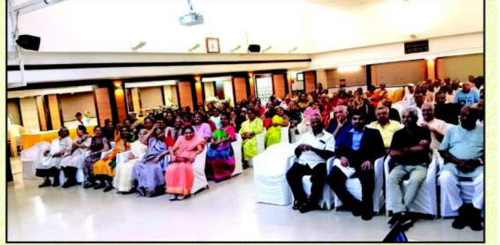
કાર્યક્રમની મજા માણતા વડીલો